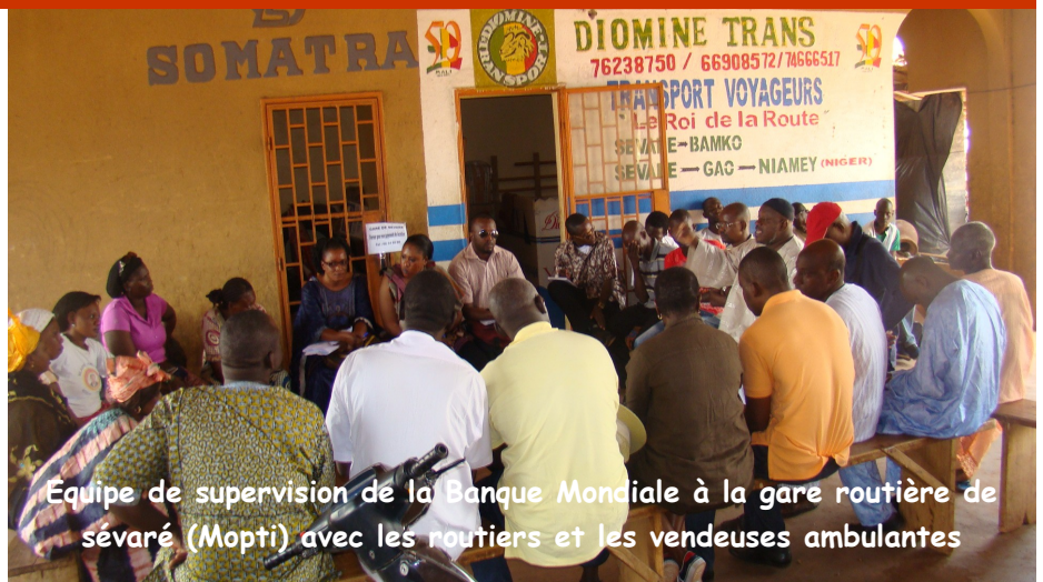
Équipe de supervision de la Banque Mondiale à la gare routière de sévaré (Mopti) avec les routiers et les vendeuses ambulantes

La mission avait comme objectif général de s'assurer de l'état d'avancement des activités, financées par les fonds additionnels conformément aux protocoles si-