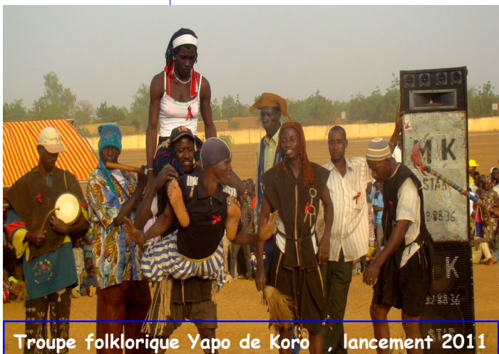
Troupe folklorique Yapo de Koro , lancement 2011

Ensemble luttons contre le VIH et le SIDA et ensemble promouvons le droit des personnes vivant avec le VIH