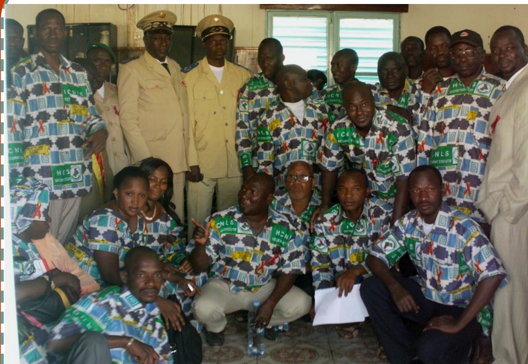
Le CAEF du Gouverneur, les autorités administratives et politiques des cercles de Koro, Bankass et les membres du Conseil Régional de Mopti.

<< Une première délocalisation du lancement de la campagne de lutte contre le VIH et le SIDA hors du cercle de Mopti. Quelle réussite! >>