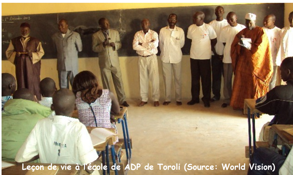
Leçon de vie à l'école de ADP de Toroli

discrimination et zéro décès lié au SIDA) d'ici 2015. La formation de 172 enseignants des six ADP de World Vision base de Koro sur la leçon de vie a eu lieu du 26 au 27 novembre 2011 à Koro. La dispensation de la leçon de vie dans 162 écoles du CAP de Koro, 14 879 élèves sensibilisés dont 7 287 garçons et 7 592 filles des classes de 5è, 6è, 7è, 8è et 9è parfois même dans les classes de 3è et 4è année. Le lancement s'est fait sous la présidence du préfet du cercle et du Directeur de World Vision en présence: des Directeurs d'écoles, des enseignants, des membres du CGS, des élus locaux, des chefs/ conseils de village, des chefs de services du cercle.