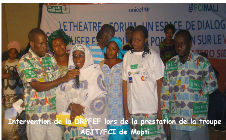
Intervention de la DRPFEF lors de la prestation de la troupe AEJT/FCI de Mopti

Conscients de l'importance de cet excellent outil de communication, le Secrétariat Exécutif du Haut Conseil National de lutte