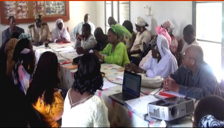
Monsieur le Gouverneur de Mopti lors de la concertation à la DRPFEF

Le 19 juillet 2011, s'est tenu dans la salle de conférence de la Direction Régionale de la Promotion de la Femme, de l'Enfant et de la Famille de Mopti, l'atelier des consultations régionales sur l'élaboration de la Politique Nationale Genre et VIH/SIDA