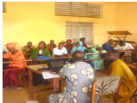
Séance de formation des ASC.