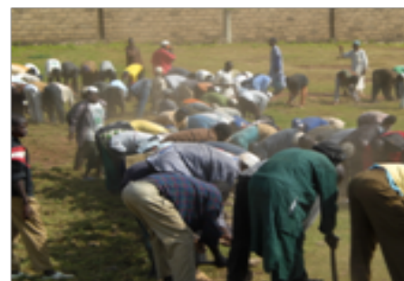
Militants de Ançar -dine en activité en septembre 2011.