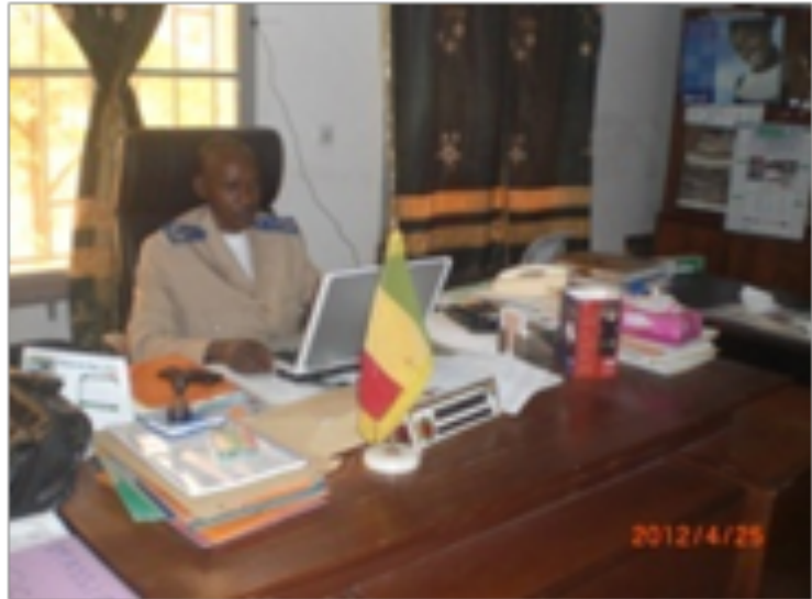
Le Préfet Afel B Yattara

EDITORIAL : L'état de santé de population constitue pour nous une préoccupation constante et d'importance. C'est pourquoi, notre administration et les collectivités, s'évertuent tous les jours à la bonne mise en œuvre de notre plan de développement sanitaire et social. Au titre de l'an 2011, les fonds communautaires ont supporté 39% des 239 millions dépensés pour le développement sanitaire. Au même moment, les collectivités consacraient environ 11% de leurs ressources aux questions de santé de leurs communautés. Il faut signaler que si globalement le taux de mobilisation des taxes et impôts par ces collectivités est passable (>60%) les charges qu'elles ont ne leur permet de faire face correctement à leurs obligations de plus en plus lourdes. Un pan important du développement sanitaire est la mise en place d'un système d'information sanitaire et social. Car il permet aux acteurs d'apprécier les efforts consentis, les résultats atteints et de mieux orienter leurs actions. En plus la production périodique de bulletin d'information permet de renforcer la visibilité des actions entreprises qui ne doivent en aucun cas rester dans l'anonymat. C'est pourquoi, nous encourageons fortement cette initiative et remercions les acteurs.