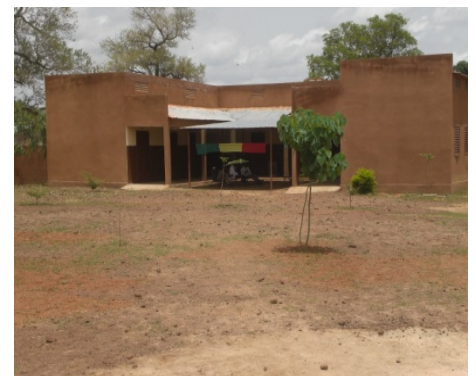
Cscm de Diogo, inauguré le 9/06/12, photo Dr Bagayoko.

importante de la couverture en soins de santé de base. La construction et la mise en marche de 16 centres de santé communautaire a permis à 81% des habitants d'avoir accès au paquet minimum de soins dans un rayon de 15kms. Le dernier centre de santé communautaire, Diogo inauguré ce mois juin 2012, dans une grande ferveur populaire va permettre de renforcer nos acquis.