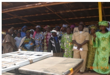
Maternité de Kokoun, C/Niantjila

-La dotation des unités de médecine et de maternité de lits, matelas et moustiquaires par la fondation orange,