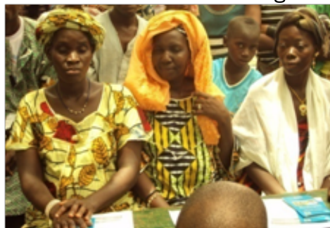
Des femmes au lancement d'une CVSS à N'djifina/wacoro

consultations curatives et prénatales, les accouchements, les actes de petite chirurgie et les médicaments. Son lancement, moment d'intense ferveur a réuni les habitants de la commune et des villages voisins des cercles de Bougouni