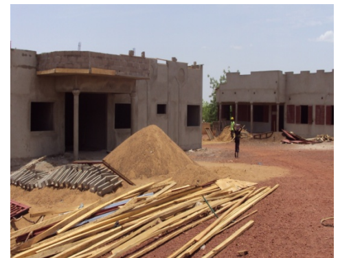
le nouveau bloc opératoire (droite) et la nouvelle maternité (gauche) du centre de santé de référence de Dioïla

des urgences, le système a dans le cadre de l'accélération de l'OMD 5 entrepris des travaux d'amélioration de son plateau technique. Le programme d'appui Néerlandais à l'accélération de l'OMD 5 a financé les travaux de réhabilitation du centre de santé de référence.