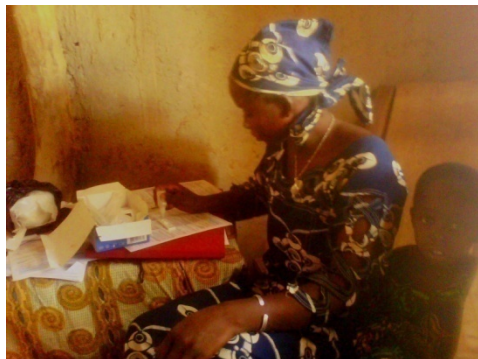
Un ASC réalisant un test de dépistage du paludisme chez un enfant de moins de 5 ans.