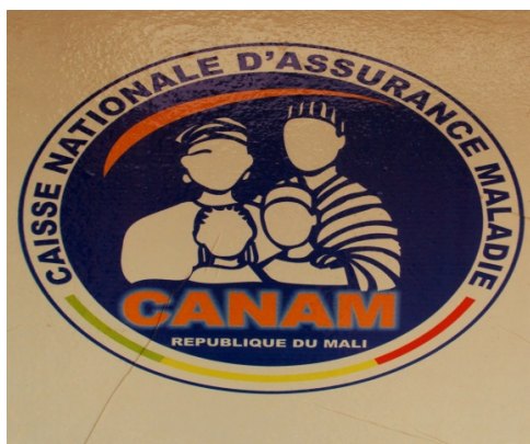
Femmes lors du lancement de la CVSS de N'djifina/Wacoro.

Lancée le 1er mai 2011, l'assurance maladie obligatoire, s'impose à ce jour comme une alternative sérieuse aux problèmes de cherté du coût des soins. En 11 mois de sa mise en œuvre dans le district, l'initiative a pu couvrir toutes les structures de soins et produit des informations éloquentes sur les opportunités qu'elles offrent. Ainsi 1164 consultations curatives, 12 consultations prénatales, 4 accouchements, 17 interventions chirurgicales, 37 examens de radiographie, et