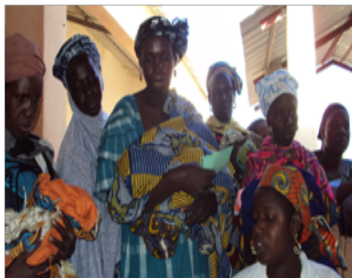
Les femmes et les enfants de Dioïla attendent beaucoup de nous

consultations/habitant/an, le taux d'utilisation de la consultation prénatale 70%, le taux de couverture en accouchement assisté 71%, la prévalence contraceptive 4%, le