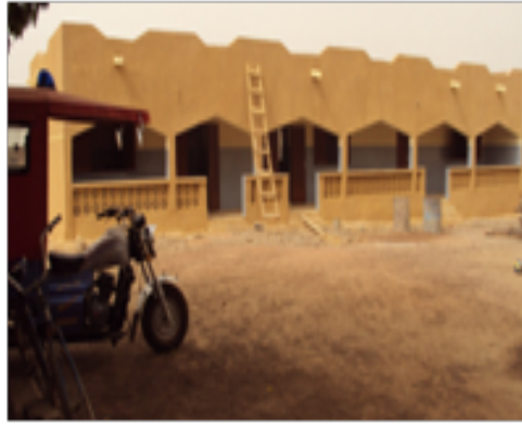
Le mini bloc opératoire de Niantjila

Ce centre doté d'un Médecin à tendance gynécologique et d'un infirmier ayant des compétences au laboratoire pourra ainsi offrir la césarienne à des femmes qui pendant 4 mois /12 sont isolées où doivent mettre plus 6 heures pour avoir accès à la césarienne. La moto ambulance mis en place dans ce centre va renforcer le transport entre ce CSCOM, ses 9 maternités satellites et ses 14 villages