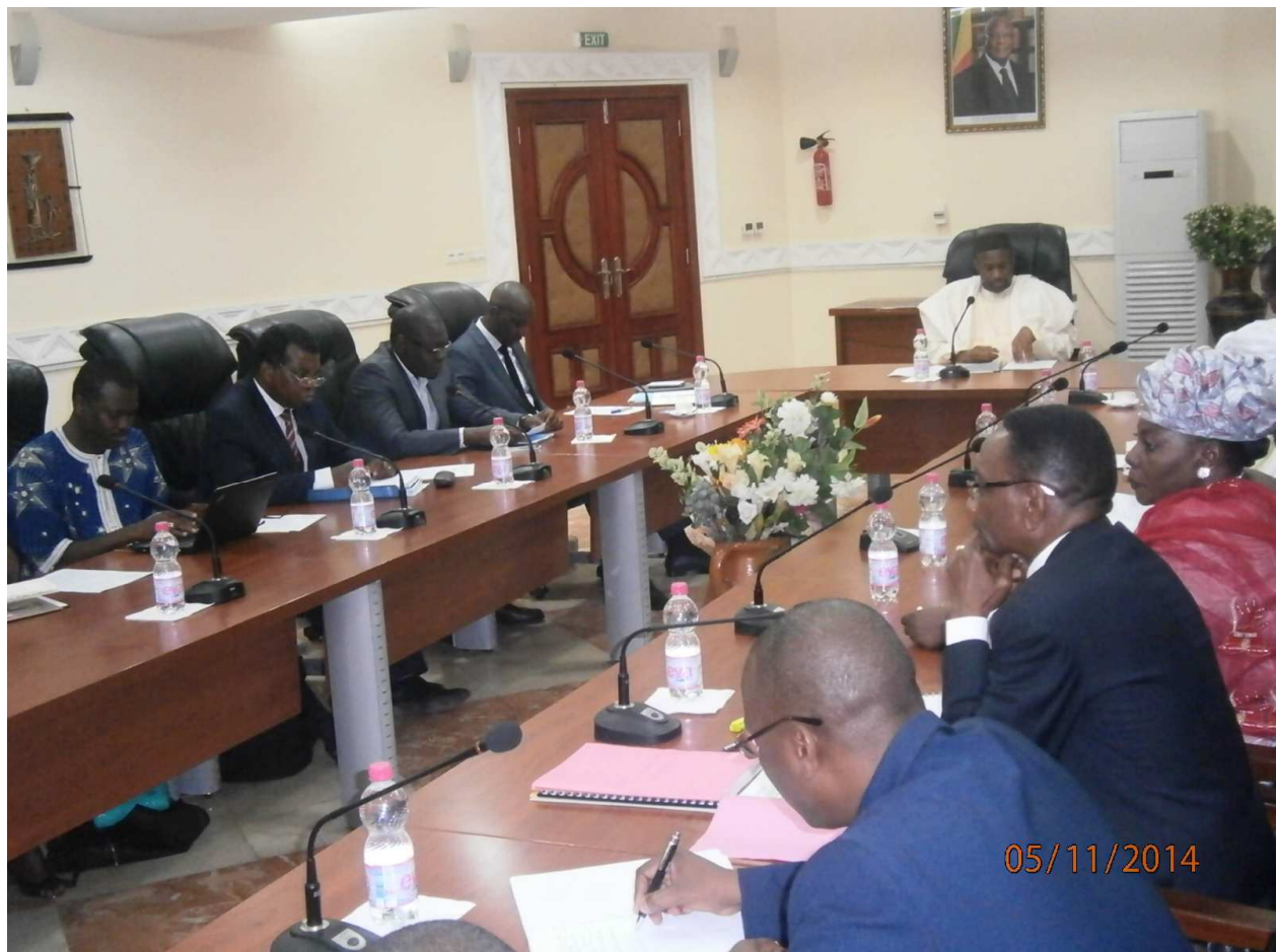
Photo1 : réunion hebdomadaire du comité interministériel de gestion des épidémies.