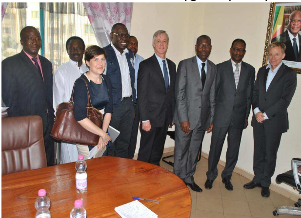
Photo 1 : Visite de du SRSG et ADG/OMS au Ministre de la santé et de l'hygiène publique