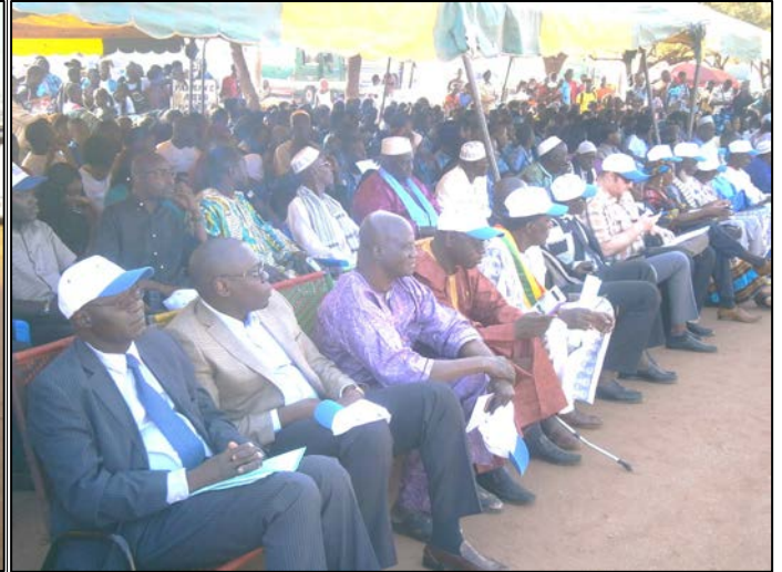
Clôture de la caravane de sensibilisation et de mobilisation sociale sur la MVE dans le district de Bamako.