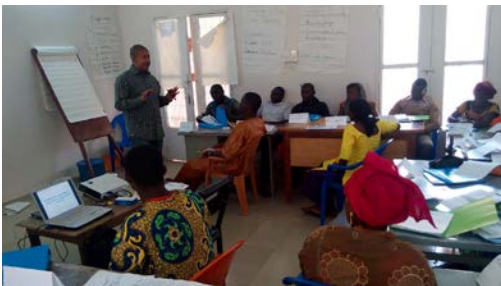
Formations de 40 agents de santé de 4 CSCOM et maternités rurales du district sanitaire de Kangaba sur la MVE financées par HELP