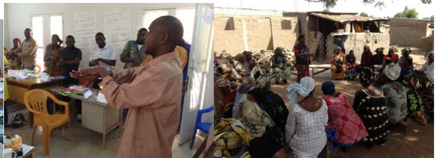
Démonstration de lavage des mains et de friction Séance d'information et de sensibilisation de 32 à la solution hydro-alcoolique lors de la formation femmes du groupement « Benkadi » de Kangaba sur la MVE

La carte ci-dessous renseigne sur la localisation des cas confirmés et probables.