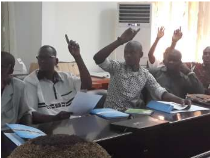
Photo 1 : Formation des techniciens de surface au niveau de l'hôpital Gabriel Touré