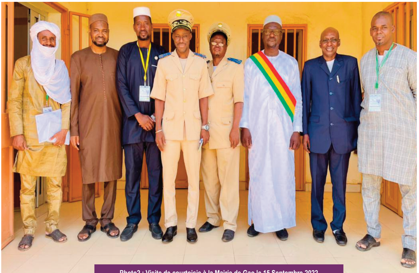
Photo2 : Visite de courtoisie à la Mairie de Gao le 15 Septembre 2022