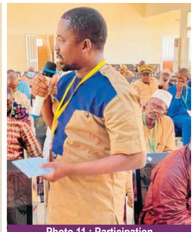
Photo 11 : Participation aux débats de la Journée Scientifique commémorant l'Arthrose