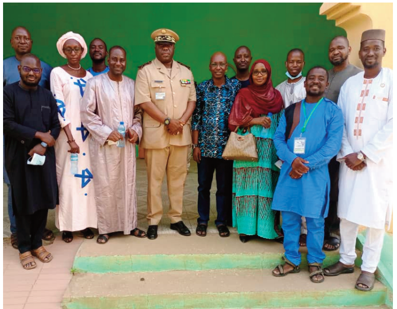
Photo1 : Visite de courtoisie au Gouverneur de la Région de Gao le 16 Septembre 2022