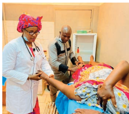
Photo 4 : Médecins en activité lors des consultations pour la mission humanitaire à Gao

Les résultats obtenus sont consignés dans les tableaux ci-dessous commentés.