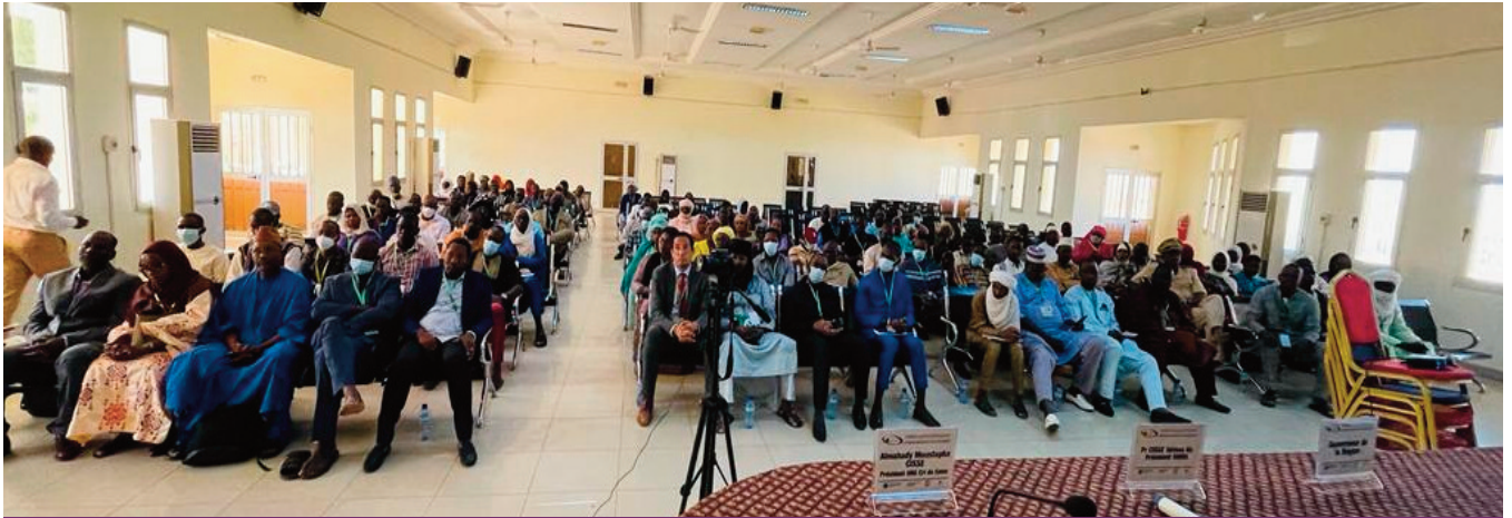
Photo 5 : Salle des Conférences du Gouvernorat de Gao lors des activités scientifiques commémorant l'arthrose le 17 Sept 2022

Les activités scientifiques envisagées en soirée le samedi 17 septembre 2022 ont été anticipées en matinée à cause d'un conflit d'agenda des autorités locales. Elles ont donc commencé à 10 heures pour finir vers 14 heures.